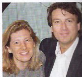
Bedrijf Suitehotel Pincoffs Sinds maart 2008

In samenspraak met de architect van SHR werden uiteindelijk zeventien kamers gerealiseerd. ‘Dat hadden er meer kunnen zijn; ze zijn niet superefficiënt ingedeeld. Maar we wilden ruime, comfortabele kamers.’ Omwille van dat comfort voor de gast nemen ze uitsluitend hbo'ers aan. ‘Die kunnen net wat verder denken en zelfstan-