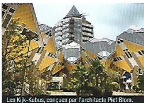
Les Kijk-Kubus, conçues par l'architecte Piet Blom.