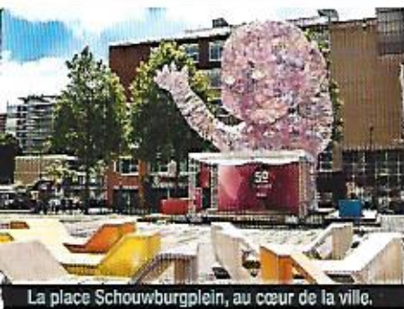
La place Schouwburgplein, au cœur de la ville.