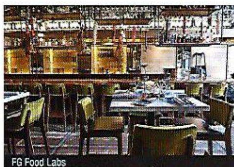
FG Food Labs

Katshoek 41 • Tél. : +31 10 425 05 20 Internet : fgfoodlabs.nl