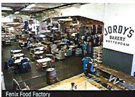
Fenix Food Factory