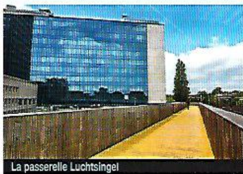
La passerelle Luchtsingel

Avant d'attirer un flux croissant de touristes, Rotterdam s'est d'abord attiré les faveurs des architectes. Les destructions de la Deuxième guerre mondiale ont laissé la place libre à des projets pour la plupart très osés, à l'image des Kijk-Kubus, des maisons cubiques inclinées à 45 degrés, ou du Luchtsingel, cette passerelle colorée financée par les habitants. Loin de s'essouffler, le dynamisme de la scène architecturale n'a jamais semblé si prolifique. En témoignent ces trois projets voisins : le complexe De Rotterdam signé Rem Koolhaas, la tour KPN pensée par Renzo Piano et bien sûr l'emblématique pont Erasme, aux allures de cygne et dessiné par Ben van Berkel. La nouvelle gare centrale, inaugurée en 2014, affirme aussi l'audace architecturale de "R'dam", plongeant d'emblée le voyageur dans ce parcours au pays du design.