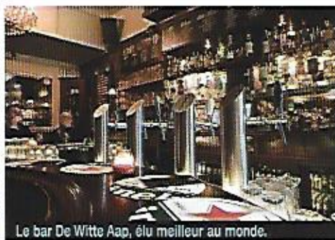
Le bar De Witte Aap, élu meilleur au monde.