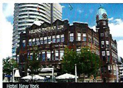
Hotel New York