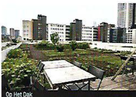
Op Het Dak

Schieblock, Schiekade 189 Tél. : +31 6 574 77010 Internet : ophetdak.com