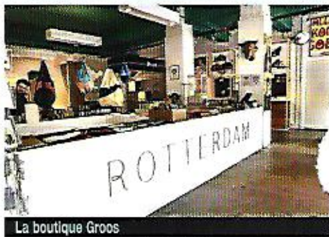
La boutique Groos