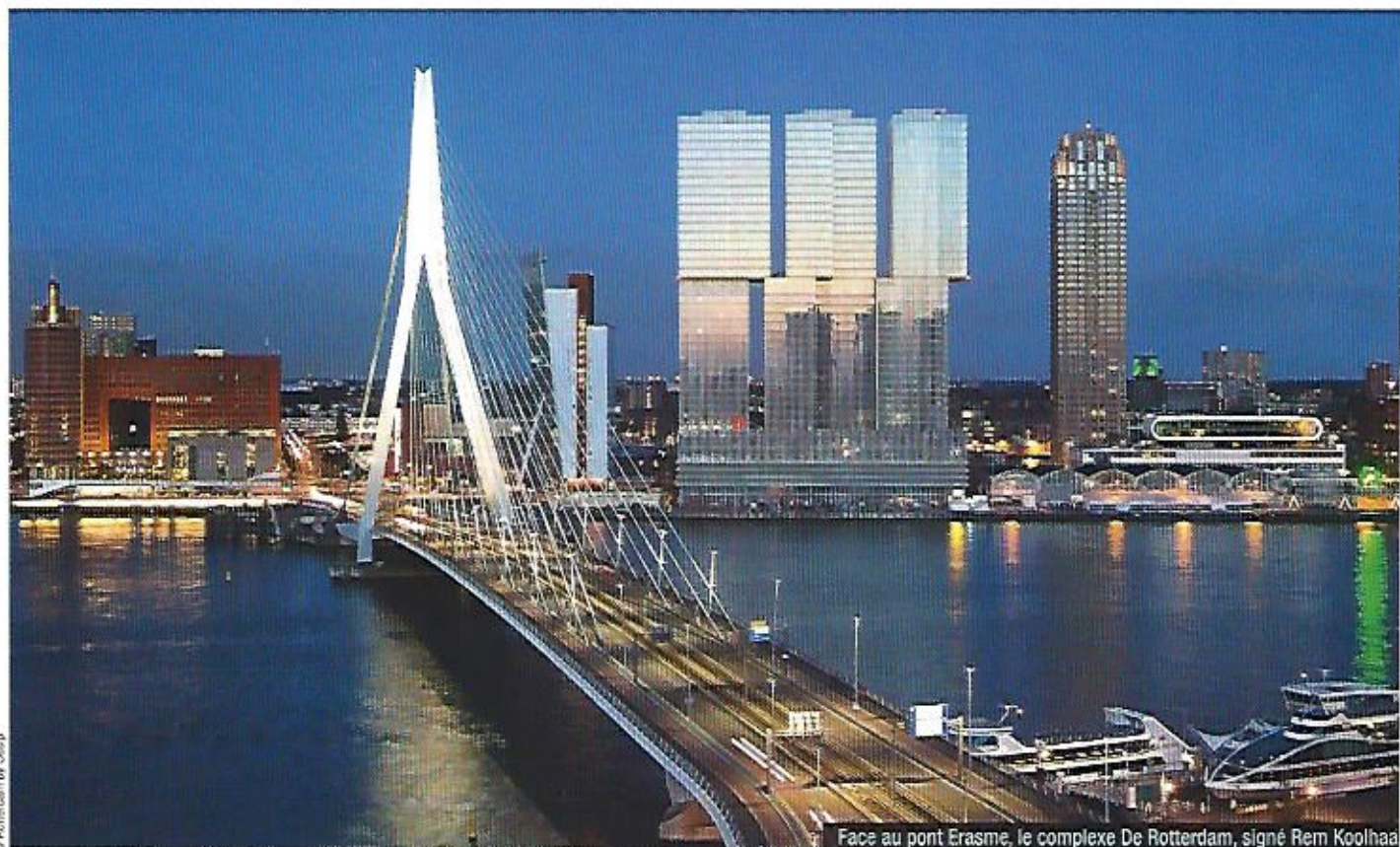
Face au pont Erasme, le complexe De Rotterdam, signé Rem Koolhaas